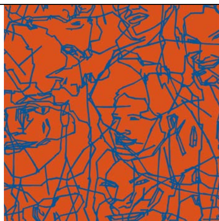
Robert Olszowski, Czas i przestrzeń, 2012, druk cyfrowy, 140 x 140 cm